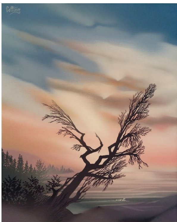
Comme une danse, peinture sur toile, 50 x 40 cm

Vu l'impossibilité de respecter les mesures de distanciation lors du vernissage, le port du masque sera obligatoire et les coordonnées des personnes présentes seront recueillies. Merci de votre compréhension.