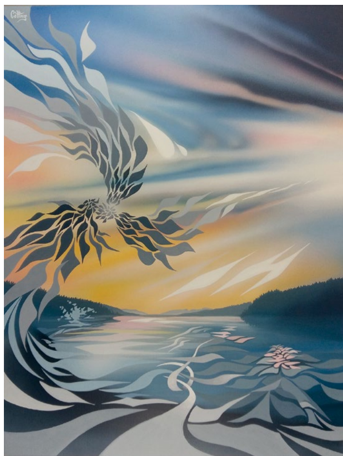
Les larmes du temps, peinture sur toile, 65 x 50 cm