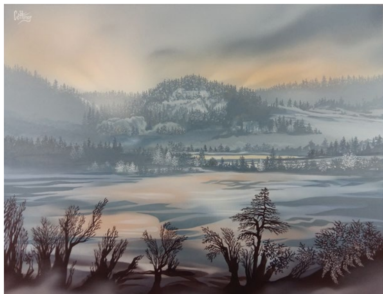
De mon atelier, peinture sur toile, 50 x 65 cm